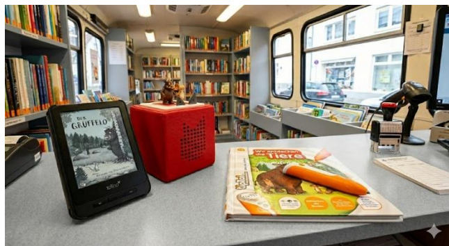
DIESES BILD IST KI GENERIERT.

Rechtzeitig zu Beginn der Gartensaison startet in beiden Fahrbüchereien wieder die heiß ersehnte Mobile Saatgutbibliothek. Auch im vierten Jahr werden Samen alter, vermehrungsfähiger Gemüsesorten ausgegeben. Diese werden von Lesern und Kindergärten im eigenen Garten ausgesät. Im Herbst wird aus einem Teil der Ernte neues Saatgut gewonnen. Dies wird dann wieder zurückgegeben und für das nächste Jahr zur erneuten Ausleihe vorbereitet.